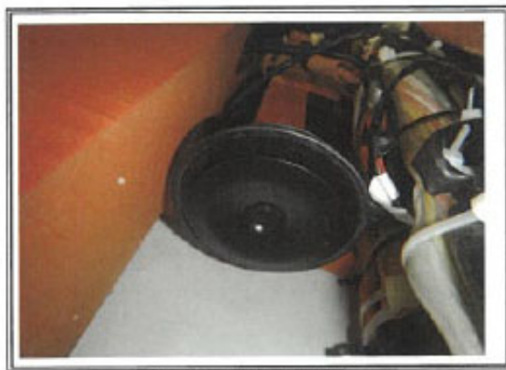
聲音警告裝置位置圖