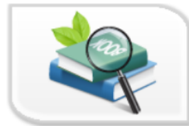
審查報告失效查詢