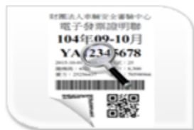
電子發票 (未確認: 278)