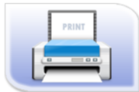
合格證與報告列印