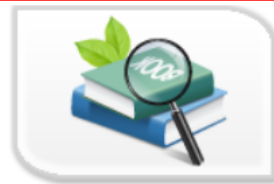
審查報告失效查詢