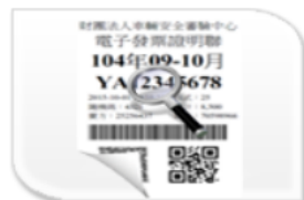
電子發票 (未確認: 278)