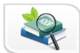
審查報告失效查詢