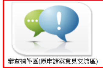
審查補件區(原申請案意見交流區)