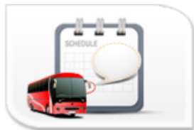
遊覽車實車比對查驗