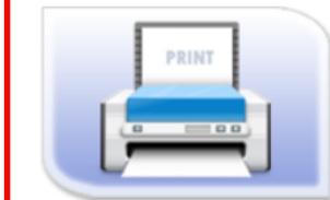
合格證與報告列印