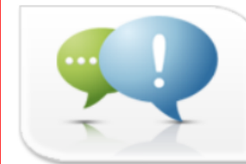
審查補件區(原申請案意見交流區)