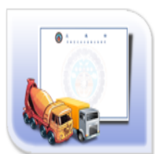
車輛型式安全審驗合格證明(多量)