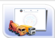
車輛型式安全審驗合格證明(多量)